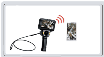
通过WIFI连接安卓设备, 实现图像实时传输